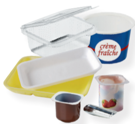
pots, boîtes et barquettes