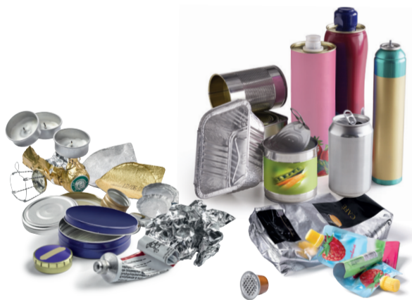
emballages métal et aluminium