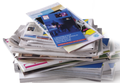
papiers, journaux, magazines et revues

Papiers, cartons et cartonnettes : au conteneur bleu