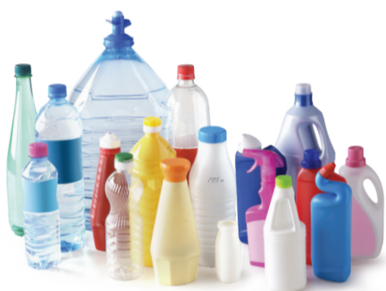
emballages et flaconnages plastiques

Emballages (vides, non lavés et non imbriqués) : dans le conteneur jaune ou sac jaune