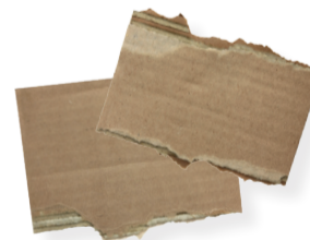
cartons bruns découpés en morceaux de moins de 40 cm