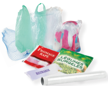
sacs, sachets et films plastiques