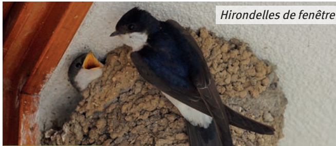
Hirondelles de fenêtre